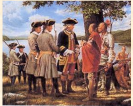
Le Marquis de Montcalm

L'affreuse « guerre » qui dure poussa le désormais Canadien à rédiger ses dernières volontés le 26 avril 1759. Il se vit, à la même époque, nommé second du célèbre Général De Montcalm lors du siège de Québec où plus de 200 navires Anglais jettent l'ancre ; 27000 Anglais face à 18000 soldats côté Français s'affrontèrent dans les désormais célèbres Plaines d'Abraham dès juillet 1759.